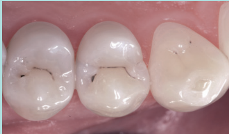
Eine kleine, unsichtbare Karies im Zahnzwischenraum...

Vor der Behandlung wählt Ihr Zahnarzt aus dem breiten Angebot der Kompositfarben die Farbe, die perfekt zu Ihrem Zahn passt.