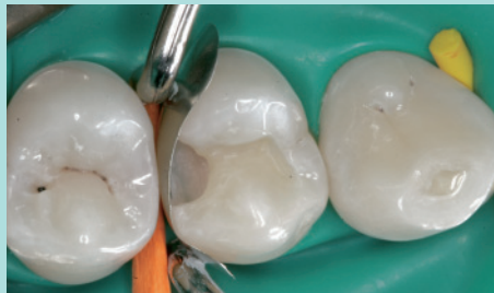
Der Defekt wird in mehreren Schritten mit dem modernen Kompositmaterial Venus® gefüllt. Jede einzelne Schicht wird einzeln ausgehärtet.