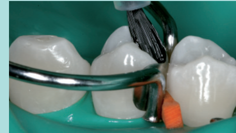
Je nach Situation kommen unterschiedliche Haftvermittler zum Einsatz.