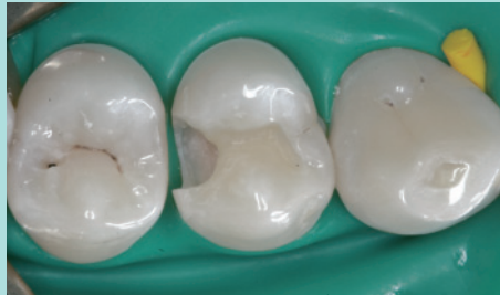
...wird unter Schonung der Zahnhartsubstanz entfernt.