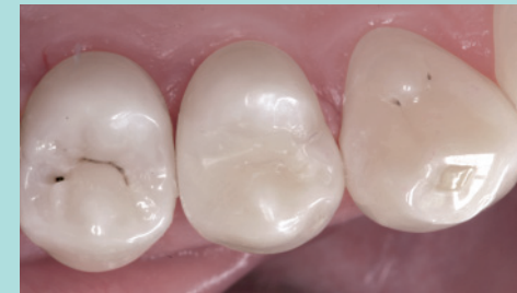
Die fertige Komposit-Füllung ist von der natürlichen Zahnhartsubstanz kaum zu unterscheiden.