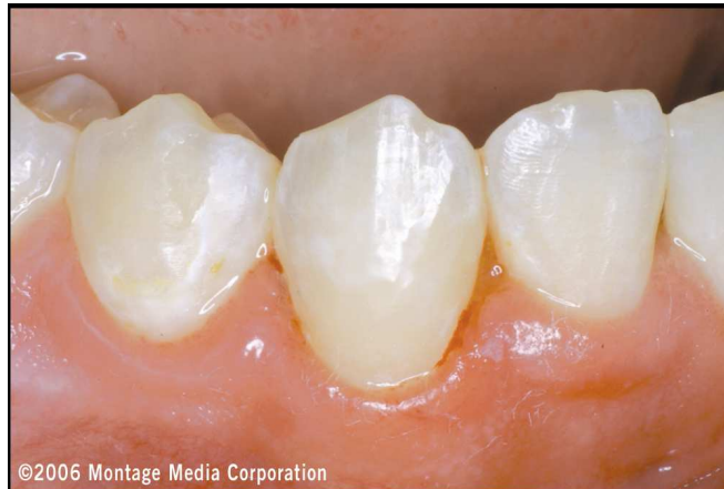
Abb. 8: Ansicht des Zahnes 43 unmittelbar nach Fertigstellung der Restauration und Abnehmen der Matrize mit minimalem Gewebstrauma und lebensechter Anpassung von Emergenzprofil, Zahnform und Farbe.

Nach dem vollständigen Aufbau der Außenform mit Komposit und der intensiven Lichtpolymerisation wurde die Folienmatrize entfernt. Es folgten abschließende Formgebung, Strukturierung der Oberfläche und Politur, um das Erscheinungsbild der Restaurationen an das der nicht präparierten Zähne anzupassen (Abbildung 8). Wegen der materialimmanenten guten Polierbarkeit des ausgewählten Mikrohybrid-Komposits konnten diese Restaurationen im Wesentlichen mit zwei Instrumenten ausgearbeitet und poliert werden. Ein flammenförmiger Hartmetallfinierer mit 30 Schneiden wurde eingesetzt, um die Konturen auszuarbeiten und die Oberfläche zu strukturieren. Die abschließende Politur erfolgte mit einem spitzen Gummipolierer (Astropol, Ivoclar Vivadent). Durch die Formgebung mit den Folienstreifenmatrizen ist eine subgingivale Politur nicht generell erforderlich und die Spitzen und Kelche sind sehr wirkungsvoll. Die Astropol-Kelche (Ivoclar Vivadent) haben einen dünnen Rand, der es bei Bedarf ermöglicht, sie an den Zahn anzupressen. Die umgekehrte Kegelform lässt eine subgingivale Politur zu. Der Oberflächenglanz wurde mit einer Polierschwabbel entsprechend dem Glanz der vorrestaurierten vestibulären Flächen erzeugt.