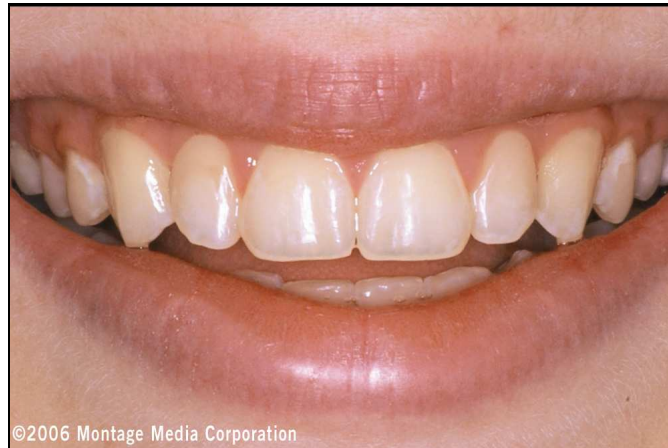
Abb. 10: Kontrolltermin nach zwei Wochen. Das Zahnfleisch ist wieder gesund.