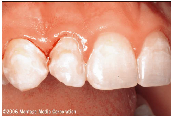
Abb. 3: Präparationen mit Pulverstrahlgerät an den Zähnen 13 bis 21. Blutungen des entzündeten Zahnfleisches sind erkennbar. Die Läsionen an den Zähnen 13 und 12 erstrecken sich in den Interdentalraum.