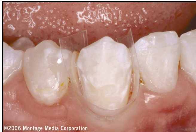
Abb. 6: Individuelle Trockenlegung von Zahn 43 mit einem konfektionierten Folienstreifen. Er ist mit Hilfe von ungefülltem Bondingkunststoff gegen Zahn und Gingivalsaum fixiert.