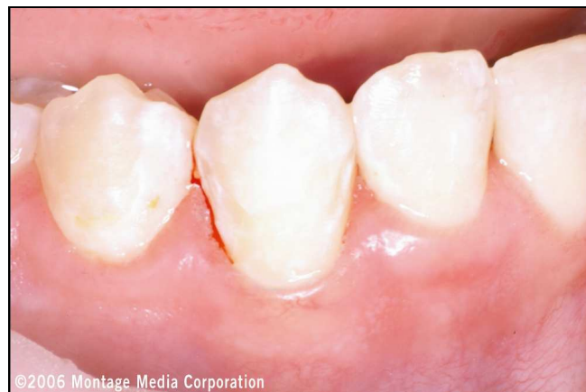
Abb. 5: Die Ausdehnung der Präparation an Zahn 43 bis subgingival ist erkennbar. Sie lässt eine Trockenlegung für die Restauration erforderlich werden.

Die subgingivale Platzierung der Restaurationsränder und die selektive Konturierung des Folienstreifens führten zu einer Oberfläche, die die Zahnfleischgesundheit langfristig unterstützt (Abbildung 6). Der gingivale Anteil des Komposits, der im Kontakt mit dem Folienstreifen ausgehärtet wurde, erhielt eine außerordentlich glatte Oberfläche ohne Sauerstoff-Inhibitionsschicht. Eine Politur dieses Bereichs erübrigt sich deshalb. Die vorgeformten Folienstreifen wurden zugeschnitten, um die labialen und approximalen Flächen der Zähne platziert und in ihrer Position mit einem ungefüllten Bondingkunststoff fixiert (Heliobond/Applikationskanülen, Ivoclar Vivadent). Er wurde zur Stabilisierung auch auf die den Zahnfleisch zugewandte Seite der Streifen appliziert (Abbildung 7).