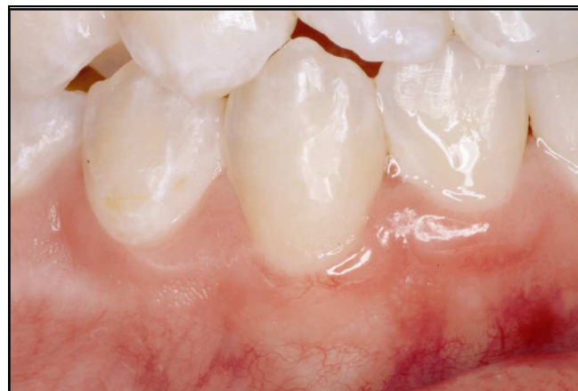
Abb. 12: Der Gesundheitszustand des Zahnfleisches ist nach zwei Wochen deutlich gebessert.

Auf diese Weise kann der Zahnarzt durch naturgetreue Restaurationen Patienten zu einer verbesserten Mundgesundheit führen und ihnen Zeit für Heilungsprozesse und das Erlernen der nötigen Fähigkeiten für ihre persönliche Mundhygiene verschaffen.