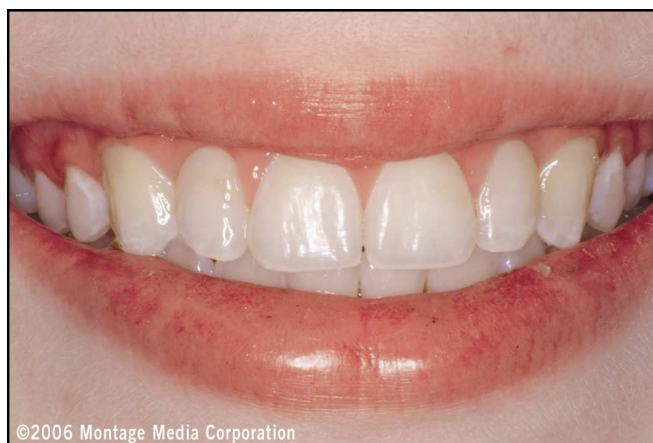
Abb. 9: Ansicht des Lächelns der Patientin nach einer Woche. Der Gesundheitszustand des Zahnfleisches hat sich verbessert.

In Kontrollterminen nach einer und zwei Wochen zeigte sich ein ausgezeichnetes Ansprechen des Zahnfleisches auf die polierten Restaurationen (Abbildungen 9 bis 12). Bei gewissenhafter häuslicher Pflege sollten diese mit minimal-invasiven Vorgehensweisen hergestellten Restaurationen der Patientin über viele Jahre hinweg Freude bereiten. Bei jedem Zahn wurden Form, Funktion und Ästhetik erfolgreich wiederhergestellt. Sollte sich die Patientin zu einem späteren Zeitpunkt dafür entscheiden, zusätzliche ästhetische Verbesserungen anzustreben, könnten vollkeramische Veneers in Betracht gezogen werden, sofern die Gingiva voll entwickelt ist und die häusliche Pflege konsequent fortgesetzt wird.