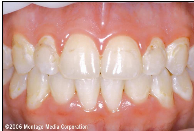
Abb. 2: Persistierende Gewebsschwellung und -rötung der Gingiva an den Oberkieferfrontzähnen nach 2 Monaten mit verbesserter häuslicher Mundhygiene und Verwendung von remineralisierender Zahncreme für die demineralisierten Bereiche.