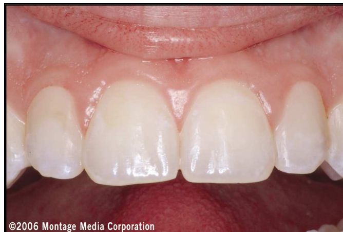
Abb. 11: Der Gesundheitszustand des Zahnfleisches hat sich nach zwei Wochen deutlich verbessert.