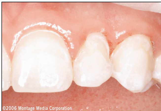
Abb. 4: Pulverstrahlpräparationen an den Zähnen 21 bis 23 mit geringeren Gewebsblutungen. An den Zähnen 22 und 23 ist die proximale Ausdehnung der Präparationen erkennbar.