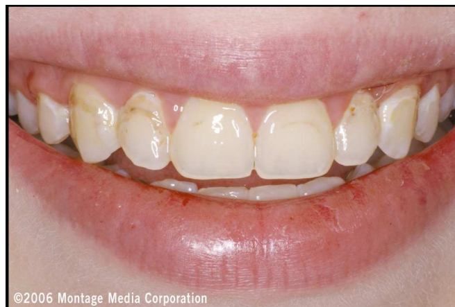
Abb. 1: Ansicht des Lächelns vor der Behandlung. Zu erkennen sind eine ganze Reihe von Zähnen mit Demineralisationen, Spuren von kieferorthopädischen Brackets und erkranktes Zahnfleisch.

Nach Abschluss der kieferorthopädischen Behandlung stellte sich ein 15-jähriges Mädchen zur Beurteilung und Behandlung der demineralisierten Bereiche auf fast allen ihrer Zähne vor (Abbildung 1). Hauptbeschwerde der Patientin war das unschöne Erscheinungsbild, das durch die Läsionen um den Rand und unterhalb der kieferorthopädischen Brackets entstand, die sie getragen hatte. Nach einer eingehenden klinischen Untersuchung und der Anfertigung von Röntgenaufnahmen wurde ein Behandlungsplan erstellt. Es sollte ein minimal-invasiver Ansatz verfolgt werden. Der Zahnarzt verordnete zunächst die Anwendung einer remineralisierenden Zahncreme, um die demineralisierte Schmelzoberfläche wieder herzustellen. [11] Sollte diese Maßnahme nicht ausreichen, um das gewünschte Ergebnis zu erzielen, würden ergänzende, minimal-invasive Maßnahmen ergriffen.