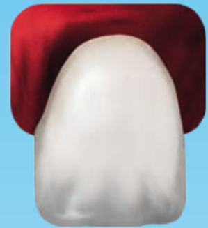
Venus ® Supra Restauration en composite, polie